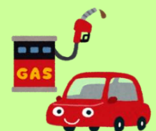
プロパンガス（メーター買い）3店